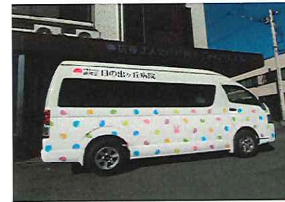
送迎車両：虹玉 定員9名