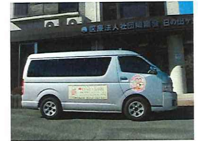
送迎車両：シルバー 定員9名